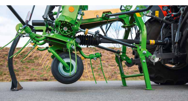
Abstellkonzept: Sicher ist Sicher