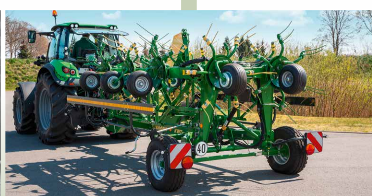
Kompakt auf der Straße