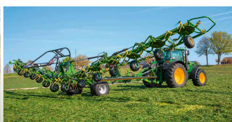
Patentierter Fahrwerksentlastung für sauberes Futter